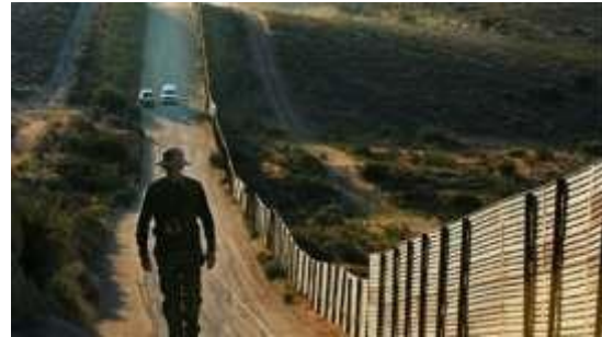
Exemple 2 : La Chine

basiques tels que le système de santé et l'éducation.